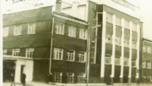
Здание Южно-Уральского геологического управления