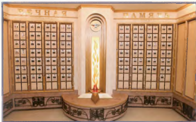
Зал памяти сотрудников МВД по Республике Башкортостан, погибших при исполнении служебного долга

Золотыми буквами на стеле, посвященной памяти сотрудников МВД по Республике Башкортостан, погибших при исполнении служебного долга, увековечены имена и фамилии тех, кто сложил свои головы в схватках с преступниками и остался до конца верным служебному долгу, защищая жизнь и спокойствие граждан. В этот список занесены имена 109 сотрудников органов и подразделений внутренних дел по Республике Башкортостан начиная с 1918 года.