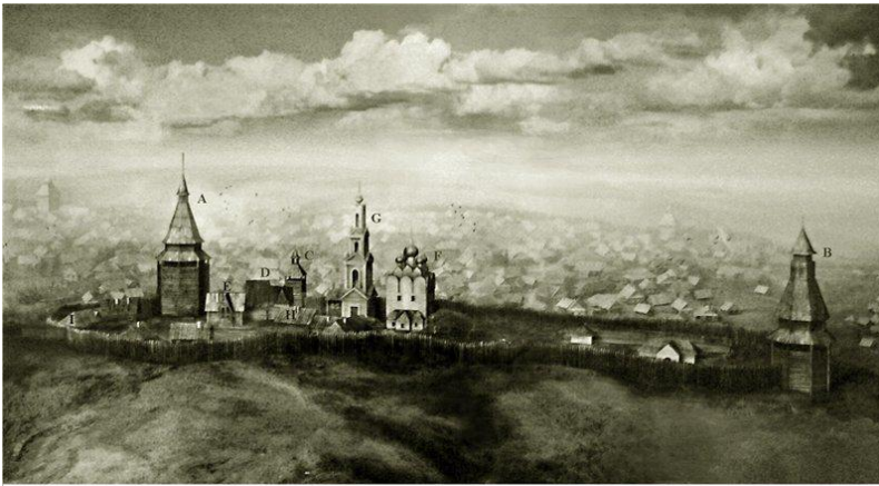
УФИМСКИЙ КРЕМЛЬ КОМПЬЮТЕРНАЯ РЕКОНСТРУКЦИЯ Рашид Аскаров